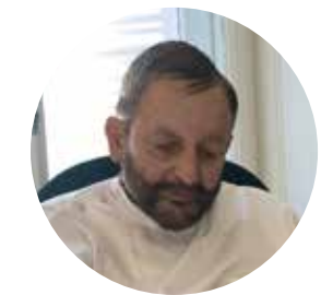
Les tests spectrophotométriques cellulaires sont simples, une petite machine reliée à l'ordinateur permet de lire dans la main du patient

Jusqu'à ce jour pas encore, ni en Suisse, ni en France, contrairement à quasiment tous les autres pays où elle est déjà introduite. Et ceci parce que peu de médecins la pratiquent déjà en Suisse, où cependant existe déjà la Société Suisse de Médecine anti-âge et préventive. Pourtant, quelques assurances la prennent, parfois, dans leurs Complémentaires. Mais la plus importante Assurance médicale va, sous peu, la prendre en charge et ceci au niveau international.