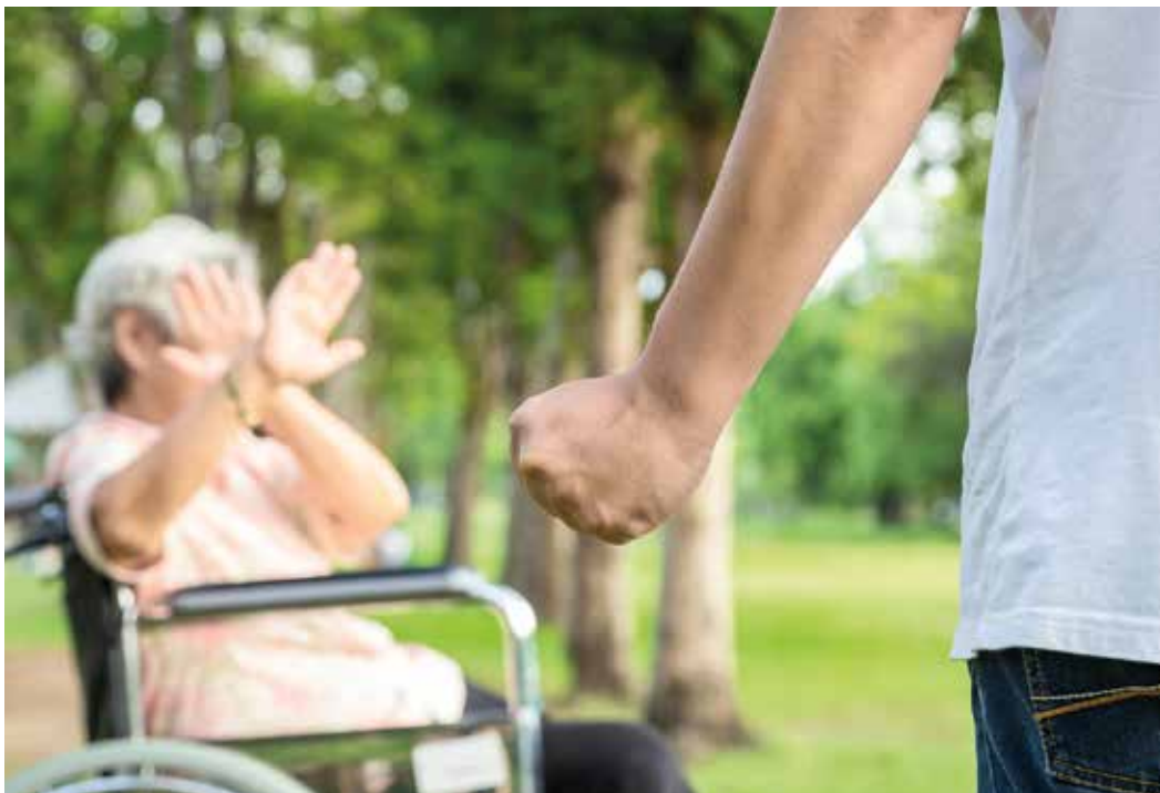
Les violences peuvent être d'ordres multiples: économiques et financiers, psychiques et psychologiques, physiques et sexuels.

Elle est souvent sournoise et peut être involontaire. Elle survient à domicile mais peut aussi arriver en institution. La violence vis-à-vis des Aînés se décline sous différentes formes allant des coups à la torture morale. Pour aider ces personnes, une permanence nationale existe. Elle s'appelle Vieillesse Sans Violence.