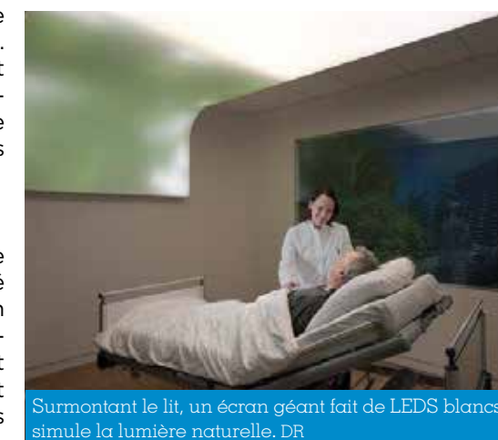
Surmontant le lit, un écran géant fait de LEDs blanches simule la lumière naturelle.